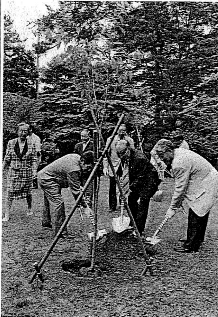
ソメイヨシノの苗木を植樹する秋高連とけやき会の会員たち

は両会と地元・秋田とのきずなを深めることを目的に行われる千秋公園の入り口にある植樹場所を選んだ。どの理由から、同館の中庭を